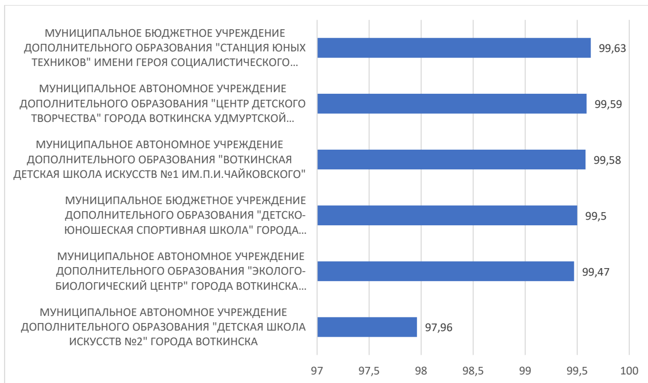
Рисунок 5 – Рейтинг организаций по критерию «Удовлетворенность условиями осуществления образовательной деятельности организаций»

По пятому критерию «Удовлетворенность условиями осуществления образовательной деятельности организаций» максимальный результат 99,63 балла набрало МУНИЦИПАЛЬНОЕ БЮДЖЕТНОЕ УЧРЕЖДЕНИЕ ДОПОЛНИТЕЛЬНОГО ОБРАЗОВАНИЯ "СТАНЦИЯ ЮНЫХ ТЕХНИКОВ" ИМЕНИ ГЕРОЯ СОЦИАЛИСТИЧЕСКОГО ТРУДА Б.Г. НИКИТИНА ГОРОДА ВОТКИНСКА УДМУРТСКОЙ РЕСПУБЛИКИ.