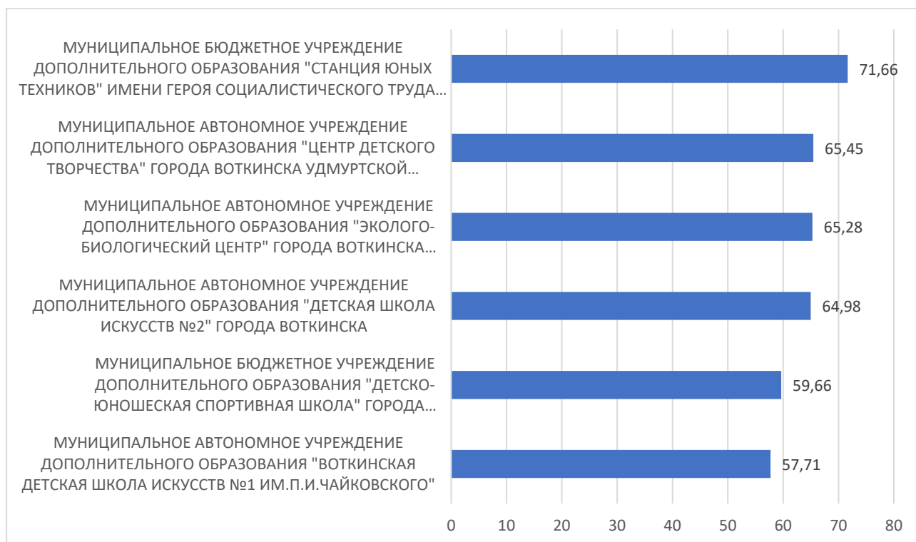
Рисунок 3 – Рейтинг организаций по критерию «Доступность образовательной деятельности для инвалидов»

По третьему критерию «Доступность образовательной деятельности для инвалидов» максимальный результат 71,66 балла набрало МУНИЦИПАЛЬНОЕ БЮДЖЕТНОЕ УЧРЕЖДЕНИЕ ДОПОЛНИТЕЛЬНОГО ОБРАЗОВАНИЯ "СТАНЦИЯ ЮНЫХ ТЕХНИКОВ" ИМЕНИ ГЕРОЯ СОЦИАЛИСТИЧЕСКОГО ТРУДА Б.Г. НИКИТИНА ГОРОДА ВОТКИНСКА УДМУРТСКОЙ РЕСПУБЛИКИ.