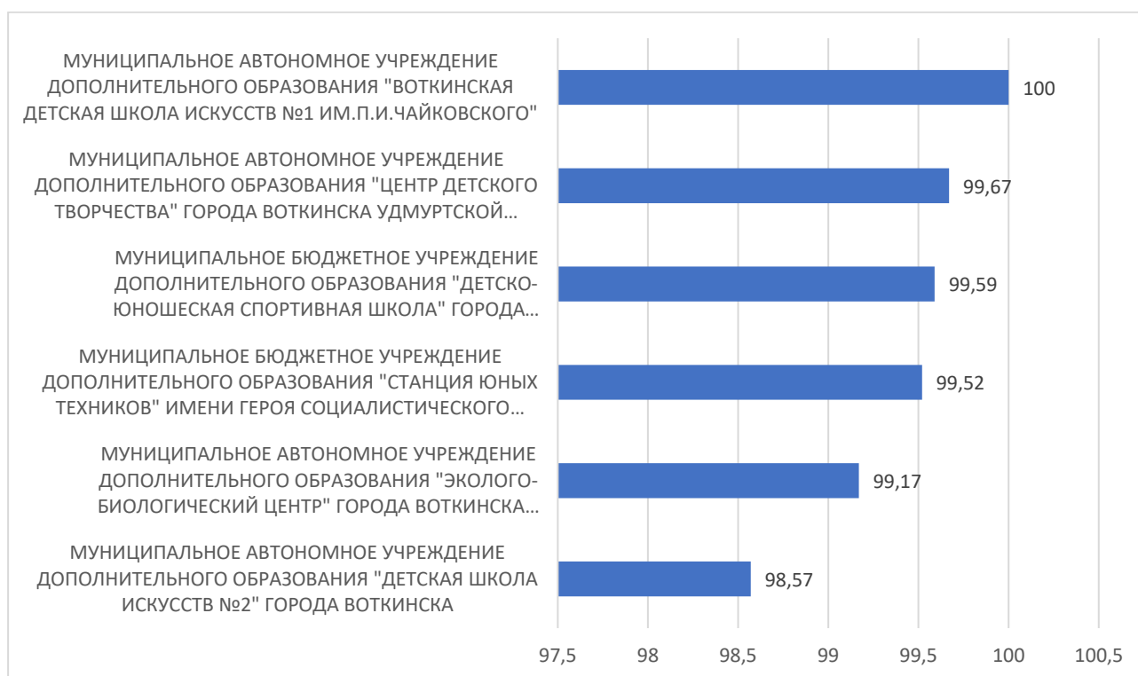
Рисунок 4 – Рейтинг организаций по критерию «Доброжелательность, вежливость работников организации»

По четвертому критерию «Доброжелательность, вежливость работников организации» максимальный результат 100 баллов набрало МУНИЦИПАЛЬНОЕ АВТОНОМНОЕ УЧРЕЖДЕНИЕ ДОПОЛНИТЕЛЬНОГО ОБРАЗОВАНИЯ "ВОТКИНСКАЯ ДЕТСКАЯ ШКОЛА ИСКУССТВ №1 ИМ.П.И.ЧАЙКОВСКОГО".